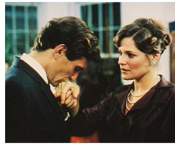
1978 IN PRAISE OF OLDER WOMEN de George Kaezender avec Susan Strasberg