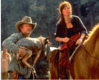
1995 LE DERNIER CHEYENNE (Last of the Dogmen) de Tab Murphy avec Barbara Hershey