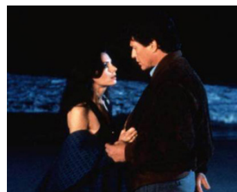
1991 TROUBLES (Shattered) de Wolfgang Petersen avec Greta Scacchi