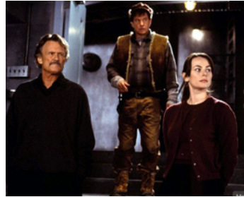
2002 COMPTE À REBOURS MORTEL (D-Tox) de J. Gillespie avec K. Kristofferson, Polly Walker