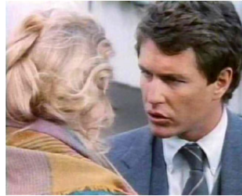
1982 DERRIÈRE LA PORTE (Oltre la porta) de Liliana Cavani avec Hannah Schygulla