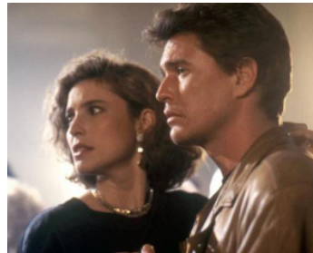
1987 TRAQUÉE (Someone to watch over me) de Ridley Scott avec Mimi Rogers