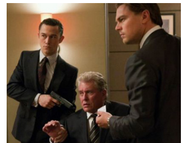
2010 INCEPTION (Inception) de Christopher Nolan avec Leonardo Di Caprio