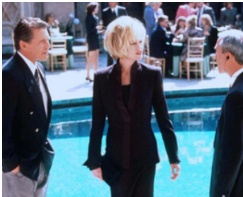
1998 LA DERNIÈRE PREUVE (Shadow of Doubt) de R. Kleiser avec Melanie Griffith, Huey Lewis