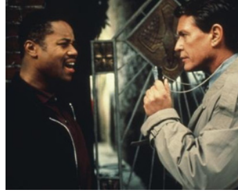
1999 MURDER OF CROWS de Rowdy Herrington avec Cuba Gooding Jr