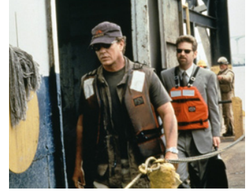
1998 THE GINGERBREAD MAN (The Gingerbread Man) de Robert Altman avec Kenneth Branagh