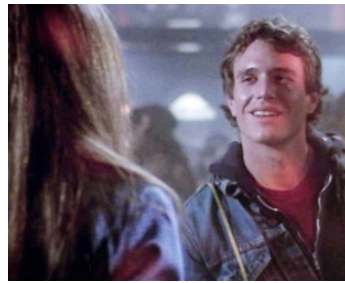
1977 À LA RECHERCHE DE M. GOODBAR (Looking for Mr Goodbar) de R. Brooks avec Diane Keaton