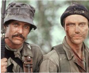
1980 LES CHIENS DE GUERRE (The Dogs of War) de John Irvin avec Christopher Walken