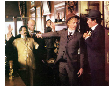
1979 LES JOYEUX DÉBUTS DE BUTCH CASSIDY ET LE KID de R. Lester avec William Katt