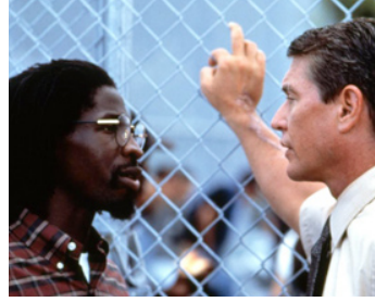
1996 LE SUBSTITUT (The Substitute) de Robert Mandel avec Glenn Plummer