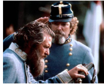
1993 GETTYSBURG (Gettysburg) de Ronald F. Maxwell avec Richard Jordan