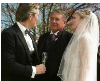
2011 DERNIÈRE VOLONTÉ (Last Will) de Brent Huff avec Patrick Muldoon, Tatum O'Neal