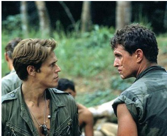
1986 PLATOON (Platoon) d'Oliver Stone avec Willem Dafoe