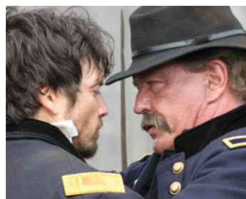
2012 WAR FLOWERS (War Flowers) de Serge Rodnunsky avec Jason Gedrick