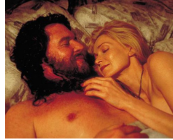
2001 WATCHTOWER (Watchtower) de George Mihalka avec Rachel Hayward