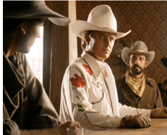
1985 REX LE MAGNIFIQUE (Rustler's Rhapsody) de Hugh Wilson