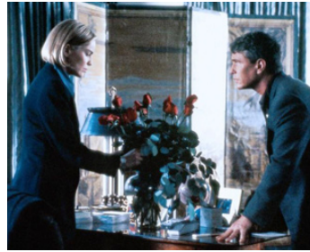
1993 SLIVER (Sliver) de Philip Noyce avec Sharon Stone