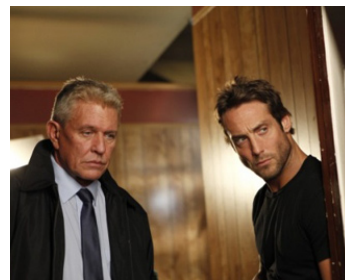
2010 BAD COP (Bad Cop) de William Kaufman avec Johnny Strong