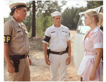
1994 CHASERS (Chasers) de Dennis Hopper avec Erika Eleniak