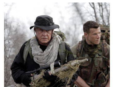
2014 SNIPER, LEGACY (Sniper, Legacy) de Don Michael Paul avec Chad Michael Collins