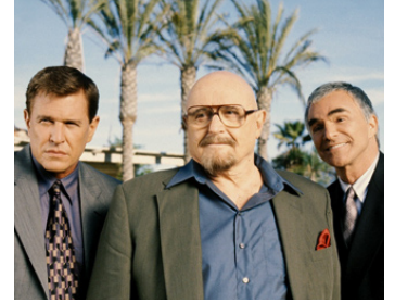
2001 BRAQUAGE À L'AMÉRICAIN (The Hollywood Sign) de S. Wortmann avec R. Steiger, B. Reynolds