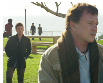
2014 BAD LUCK (Bad Luck) de John Herzfeld avec Kevin Connolly