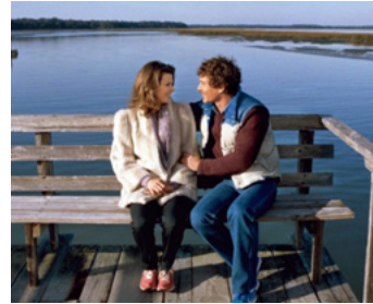
1983 LES COPAINS D'ABORD (The big Chill) de Lawrence Kasdan avec Mary Tyler Moore