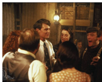
1990 THE FIELD (The Field) de Jim Sheridan avec Brenda Fricker