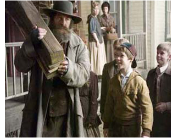
2007 LE MIRACLE DE NOËL (The Christmas Miracle of Jonathan Toome) de Bill Clark