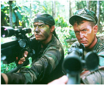
1993 TIREUR D'ÉLITE (Sniper) de Luis Llosa avec Billy Zane