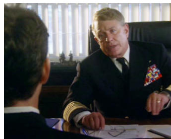
2009 DES SERPENTS À BORD (Slent Venom) de Fred Olen Ray