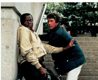
1988 RANDONNÉE POUR UN TUEUR (Shoot to Kill) de Roger Spottiswoode avec Sidney Poitier