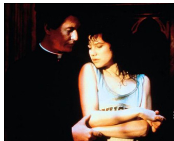
1988 CRIMES DE SANG (Last Rites) de Donald P. Bellisario avec Daphne Zuniga