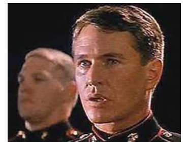
1989 NÉ UN 4 JUILLET (Born on the Fourth of July) d'Oliver Stone avec Richard Haus