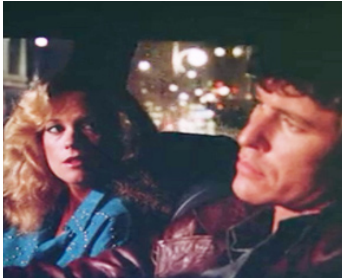
1984 NEW YORK, DEUX HEURES DU MATIN (Fear City) d'Abel Ferrara avec Melanie Griffith