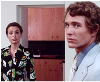
1977 LA SENTINELLE DES MAUDITS (The Sentinel) de M. Winner avec Cristina Raines