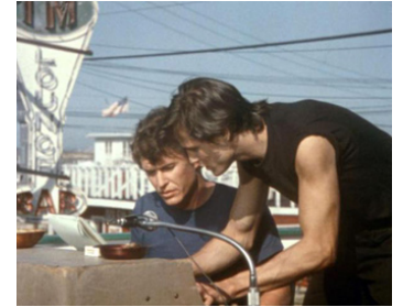
1983 EDDIE AND THE CRUISERS de Martin Davidson avec Michael Paré