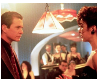
1990 L'AMOUR POURSUITE (Love at Large) d'Alan Rudolph avec Elizabeth Perkins