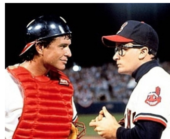
1989 LES INDIANS (Major League) de David S. Ward avec Charlie Sheen