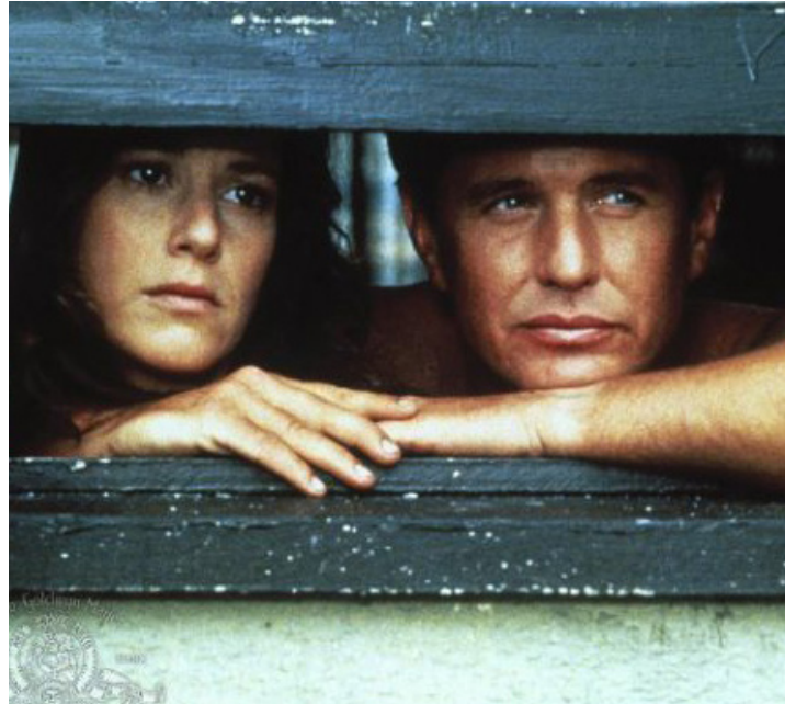
1988 LA MAIN DROITE DU SEIGNEUR (Betrayed) de Costa-Gavras avec Debra Winger